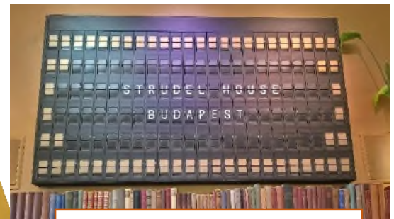
Seniorenreise Budapest im Mai